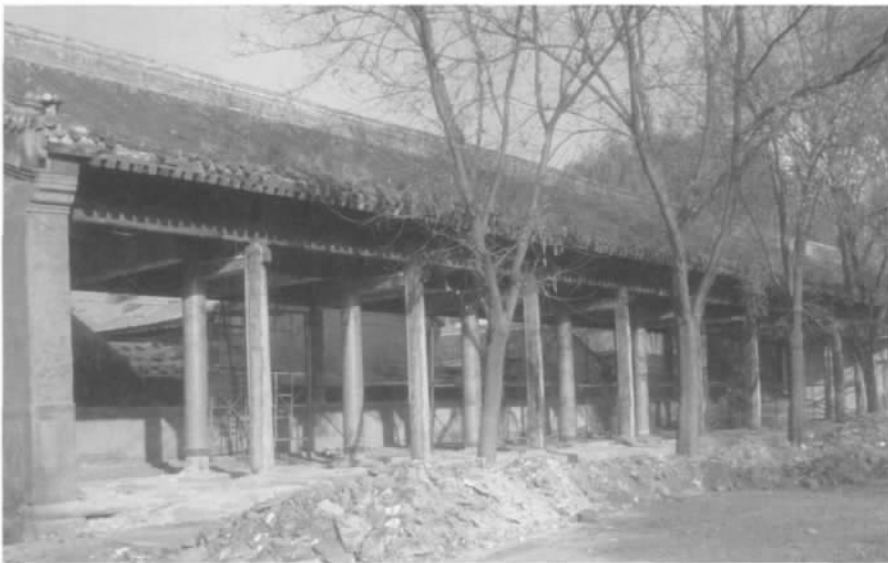
图二 修复前的文庙西配殿

热河文庙的保护与利用得到了各级政府的高度重视及社会各界的极大关注,对其进行全面修复,进而有效保护、合理利用,是承德文物工作的一项重要任务。目前,承德市文物局正在投入大量资金,集中人力、物力,按照整体保护规划分步实施对文庙的全面整修。为了确保热河文庙历史的真实性与完整性,做了许多艰苦细致的前期基础工作,如召开专家论证会,查阅大量文献档案资料,广泛搜集国内外有关热河文庙的老照片,借鉴国内各大文庙的保护维修经验等,为热河文庙的修复、保护、利用以及研究打下了良好的基础。