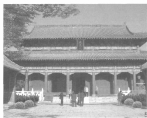
图1 文庙总平面图 图2 文庙全景 图3 泮池及泮桥 图4 棂星门与孔子行教像 图5 大成殿